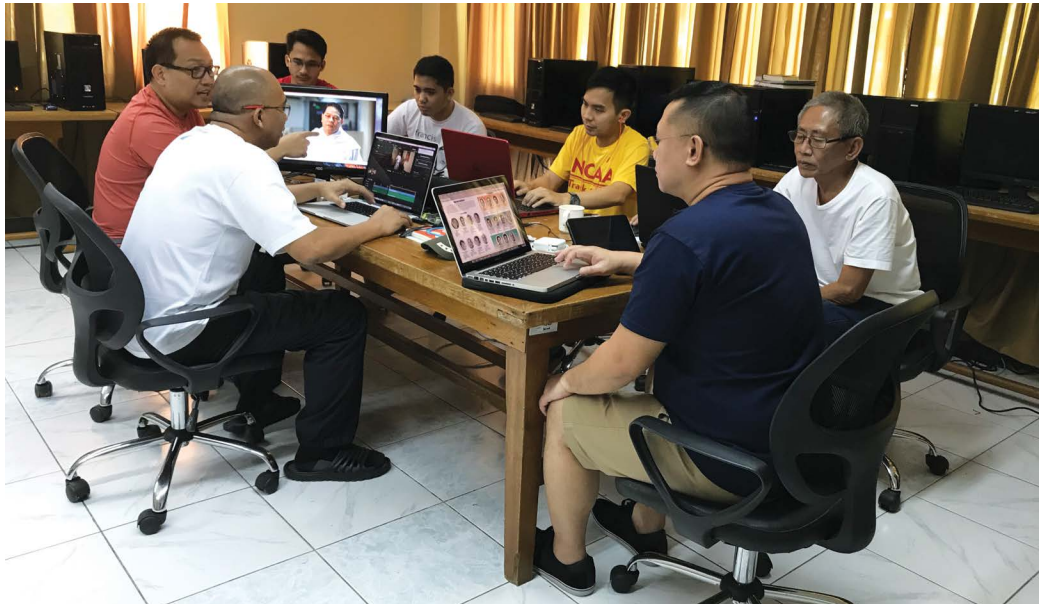
Los miembros del Secretariado del Capítulo trabajando.

CIUDAD DE CEBÚ —Un plan ambicioso para lograr el éxito lleva consigo buena preparación y sinergia.