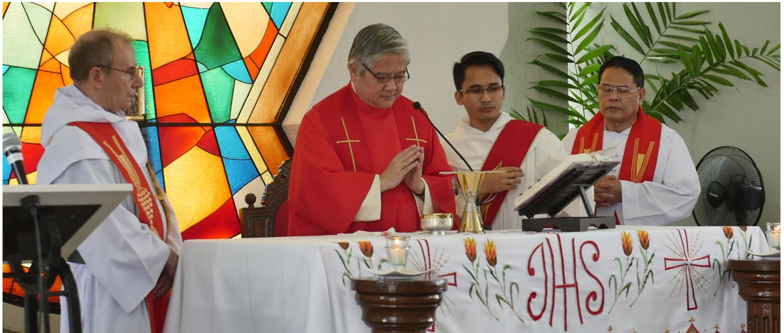
El Arzobispo Socrates Villegas, DD flanqueado por el Prior General y Prior Provincial.

L A CIUDAD DE CEBÚ – El Arzobispo Socrates Villegas, el celebrante principal de la Misa votiva del Espíritu Santo para el Séptimo Capítulo Provincial, desafió los delegados a preguntarse con toda sinceridad las tres preguntas: “¿Dónde está tu corazón? ¿Dónde está tu alegría? ¿Quién realmente eres tú?” en el inicio del Séptimo Capítulo Provincial.