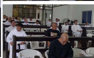
Las fotos muestran los capitulares rezando los laudes. La foto en la parte superior derecha muestra el Arzobispo Socrates Villegas, DD rezando con los delegados del Séptimo Capítulo Provincial.